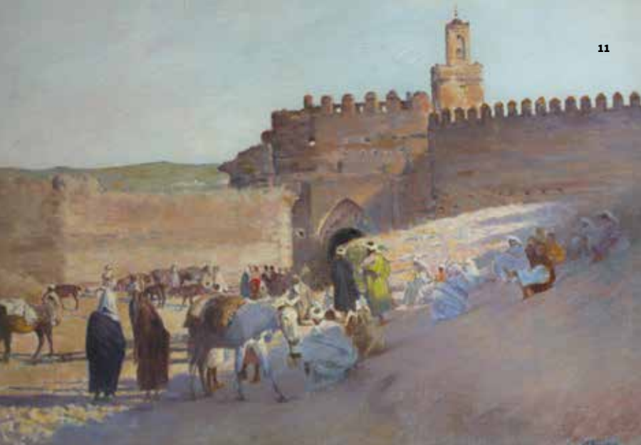
11. J.-F. Bouchor, Le Conteur à Bab Guissa, MN 521